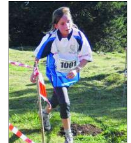
Sur de plus petites distances, les enfants ont pu imiter les grands.