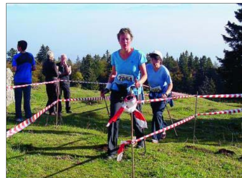
Les premières «Nordic Walkeuses» passent la ligne d'arrivée.