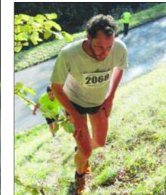
Dans certaines portions, un pas claudicant remplace les foulées galopantes.