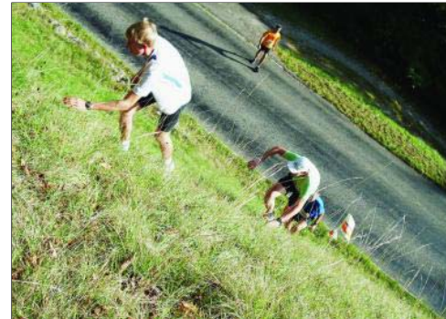
C'est sûr, le Derby de la Corentine, ça monte et ça grimpe!